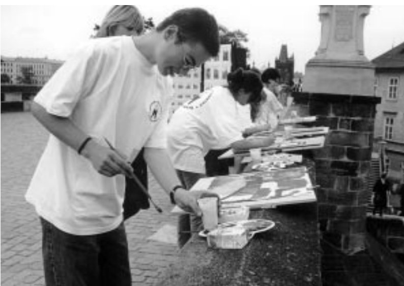
Děti malují přímo na Karlově mostě.