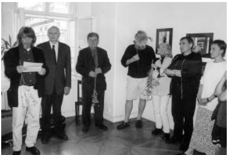
Zahájení výstavy Malostranské figurky

Jako již tradičně, byl i letos v létě věnován v OGB prostor malostranské fotografii. Tentokrát to byla výstava Malostranské figurky . Slavnostně otevřena byla již 18. června a trvala až do 9. září.